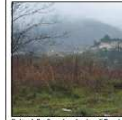
Il sito della discarica abusiva di Bussi: ieri clamorosa svolta nel processo sull'inquinamento

PESCARA - Fatta la legge che taglia gli stipendi ai consiglieri regionali. La Commissione Bilancio ieri pomeriggio ha dato il via libera alla legge Pagano che finalmente approderà in Consiglio regionale il prossimo 3 agosto. Ma la maggioranza ha provato a far passare l'istituzione di un'indennità per il vice capogruppo. La proposta respinta, ma la maggioranza immagina di ripresentarla in autunno magari con una legge ad hoc. Alla faccia del risparmio: l'indennità è stato revocato il bando di concorso per l'assunzione di un dirigente tecnico alla Sangritana, dopo le rivelazioni di Il Messaggero. Monidara a pag. 33