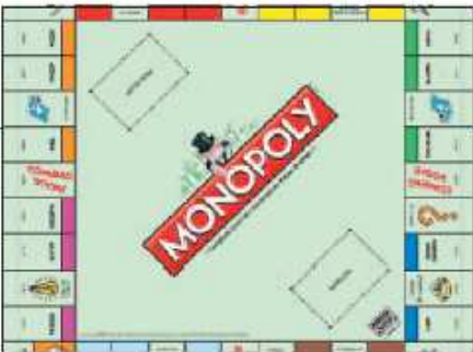
Il Monopoly: nell'edizione italiana al posto del Parco della Vittoria c'è Chieti

Chieti trionfa nel Monopoly (versione italiana) e vedrà il suo nome al posto del Parco della Vittoria nella nuova edizione dedicata al Belpaese del gioco da tavolo più famoso al mondo. Il capoluogo di provincia abruzzese, battendo tutte le altre città italiane, si è infatti guadagnato la casella più pregiata tra le 22 del tabellone del Monopoly italiano raccogliendo