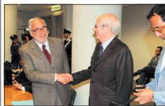
Gli ex governatori Ottaviano Del Turco e Giovanni Pace in Tribunale a Pescara

La positiva soluzione per Cardiocirurgia - un caso divenuto economico, burocratico e politico - è stata raggiunta al termine di un incontro svolto tra il direttore generale della Asl Lanciano-Vasto-Chieti Francesco Zavattaro con un nutrito staff dell'Ufficio Tecnico dell'Azienda, i rappresen-