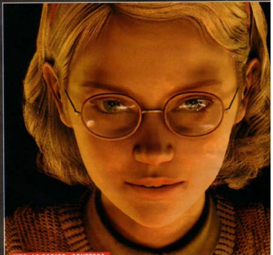
MEG, LA SADICA «CONTESSA»

Diana è una delle leader negative delle bambine che popolano la casa. Si fa chiamare la Duchessa ed è maligna, vendicativa, sadica e con tendenze omosessuali.